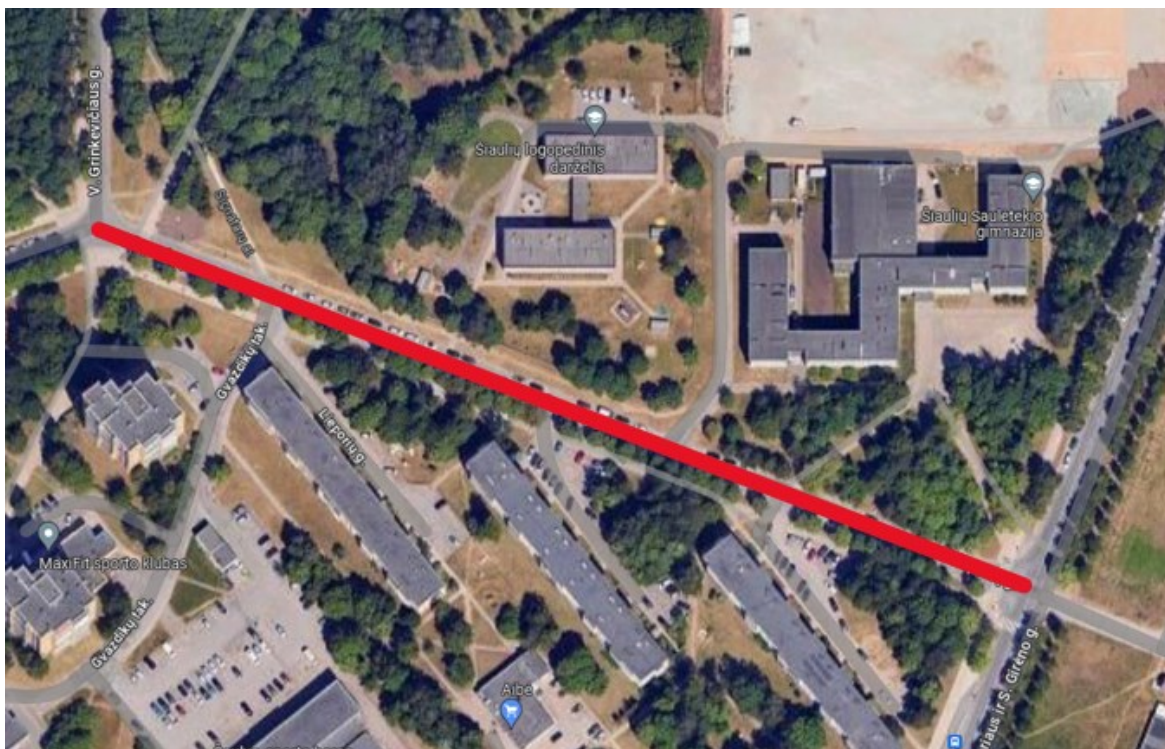
1 pav. Situacijos schema